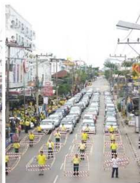
80 passengers and 80 cars