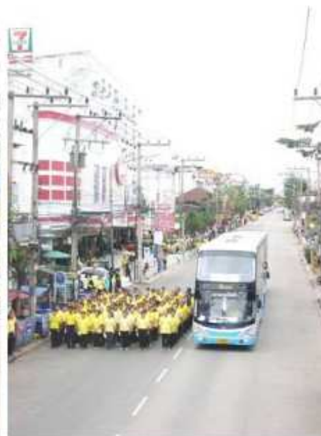
80 passengers and a bus